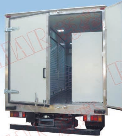
抢修/维修工程车改装