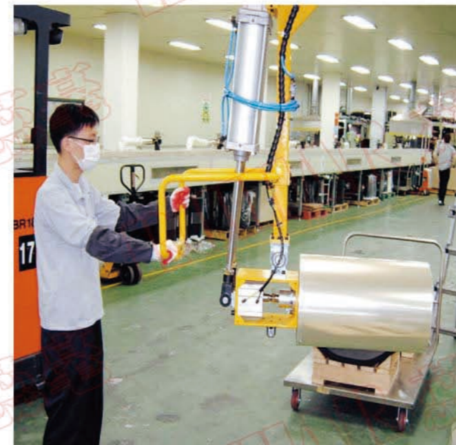
搬运升降/移动夹具

功能: V型钳口可配置多种不同尺寸及规格的活动钳口, 满足各种产品的夹紧, 整体液压夹紧, 电动一键式控制模式