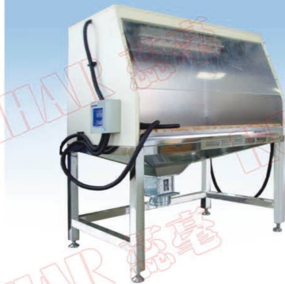
打磨净化吸尘工作台